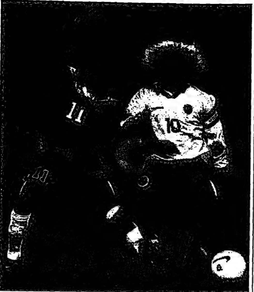
طفلة من مباراة تشيلي وكولومبيا (ديوت)